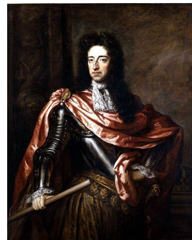
William III and Mary, 1689 to 1702