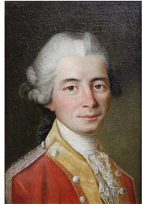
An officer of the Régiment de Clare , 1767