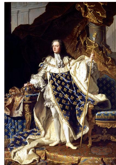
Louis XV le Bien-Aimé , 1715 to 1774