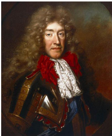
James II, 1685, deposed 1688 (Glorious Revolution), escaped to France