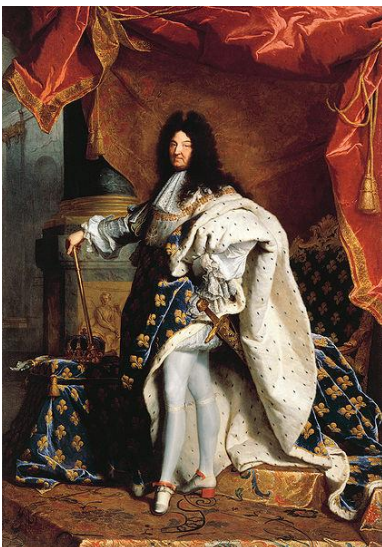
Louis XIV le Grand, le Roi Soleil , 1643 to 1715