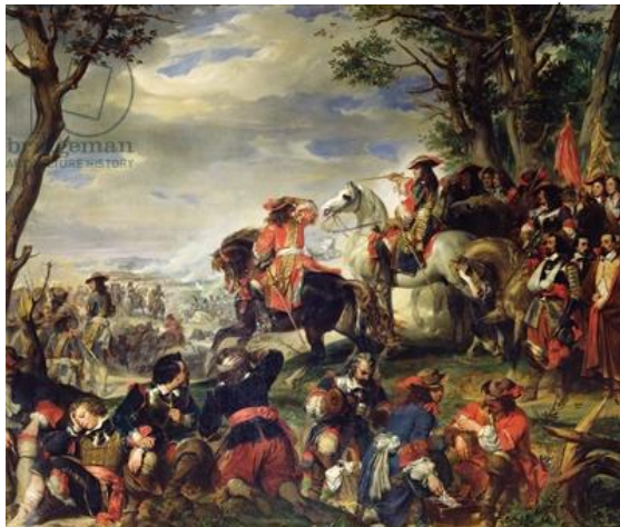
The Battle of Marseilles, 1693

He was Captain of a Company of one hundred men in 1689 and commanded in the war in Ireland. Arriving in France, he was accorded a Company in the Regiment of O'Brien (from Clare) by commission of July 10, 1691. He commanded at the siege of Montmélian the same year, in the Italian army who stood on the defensive in 1692. at the Battle of Marseille in 1693, Italy in 1694 and 1695 at the siege of Valencia in 1696, and became commander of the third battalion that year. He served in that capacity in the army of the Meuse in 1697.